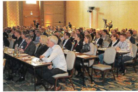
Volles Haus beim Küchentreff-Forum: 270 Gäste trafen sich in Berlin

KÜCHENTREFF ist 2018 um 25 auf 357 Mitglieder im In- und Ausland gewachsen. Insgesamt 416 Küchenstudios werden unter dem Verbandslogo betrieben, davon 134 im Ausland. Vor allem in Österreich will der Verband 2019 wachsen. Um den Wachstumskurs fortzusetzen, stellte der Verband auf dem Küchentreff-Forum Einkaufserlebnisse, Storytelling, Online und Social Media in den Mittelpunkt. Ein Schulungsprogramm hilft den Mitgliedern bei der Umsetzung.